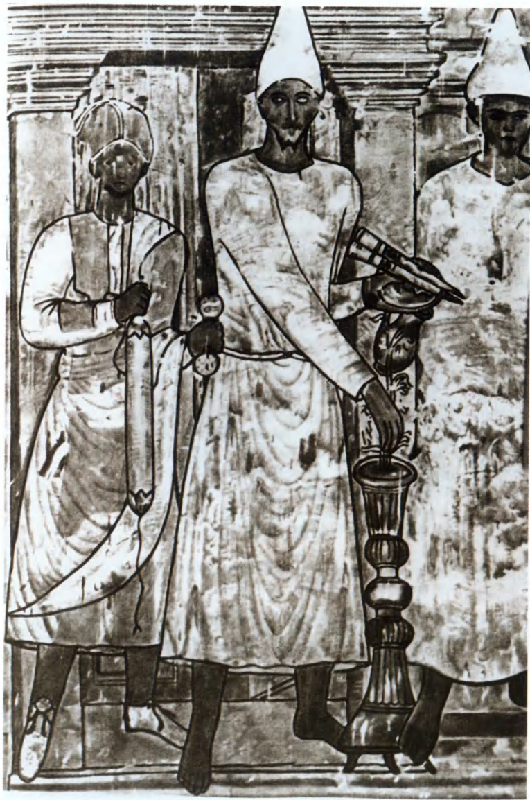
Языческие иерофанты, приступающие к ритуалу посвящения. Фреска из Дура-Эвропос