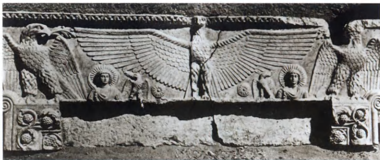
Солнечные божества под защитой римских орлов Барельеф из Пальмиры.

Митра, приносящий в жертву солнечного быка.