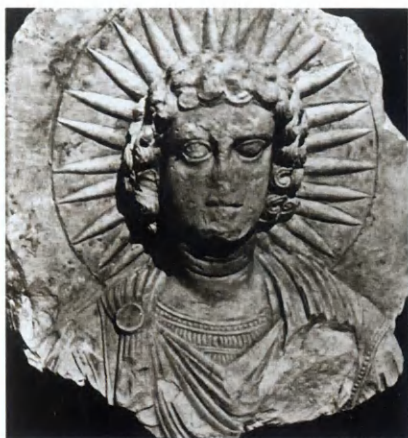
Солнечное божество. Храм Ваал-Шамина в Пальмире