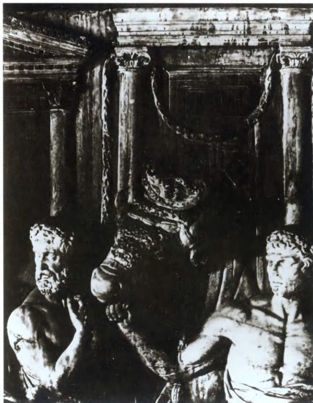
Римские солдаты, ведущие быка для жертво- приношения.