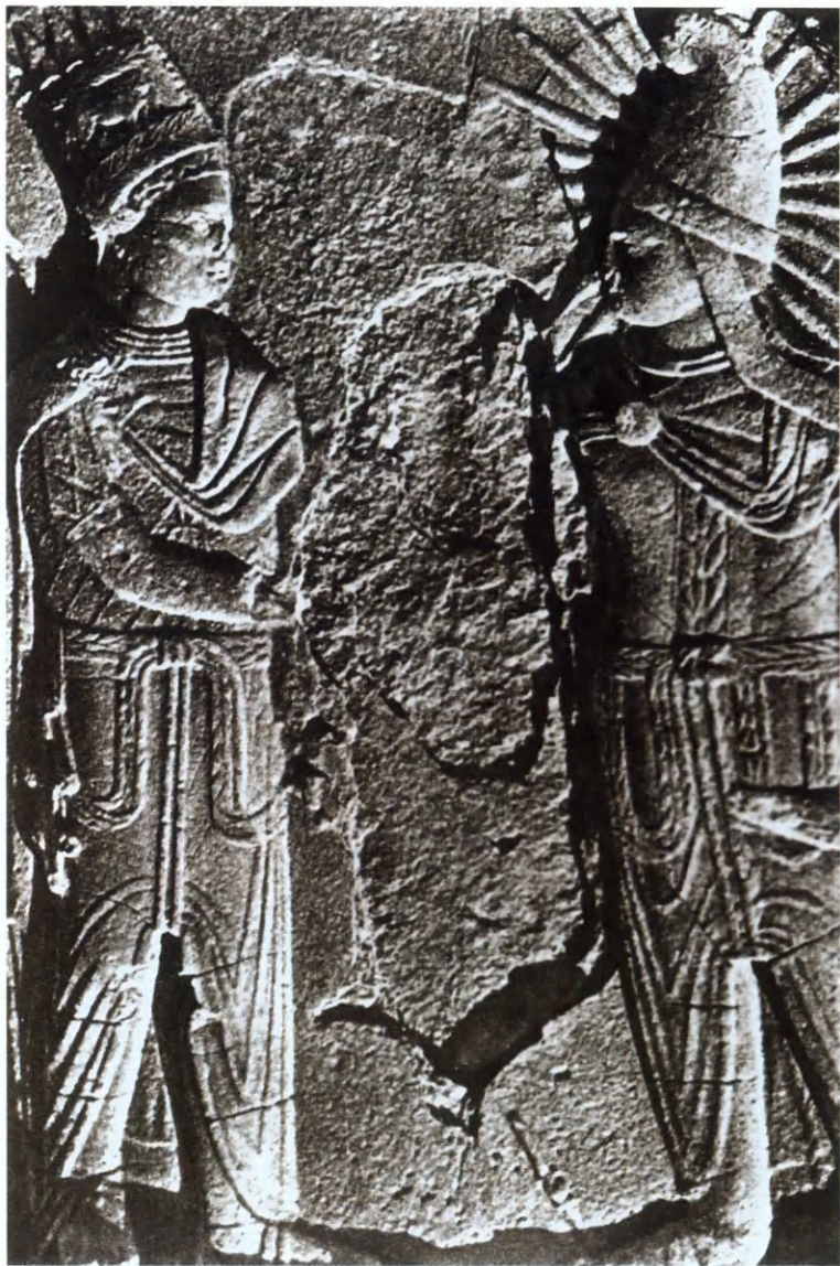
Митра (справа) посещает царя Антиоха. Барельеф в Нимруд-Дже.