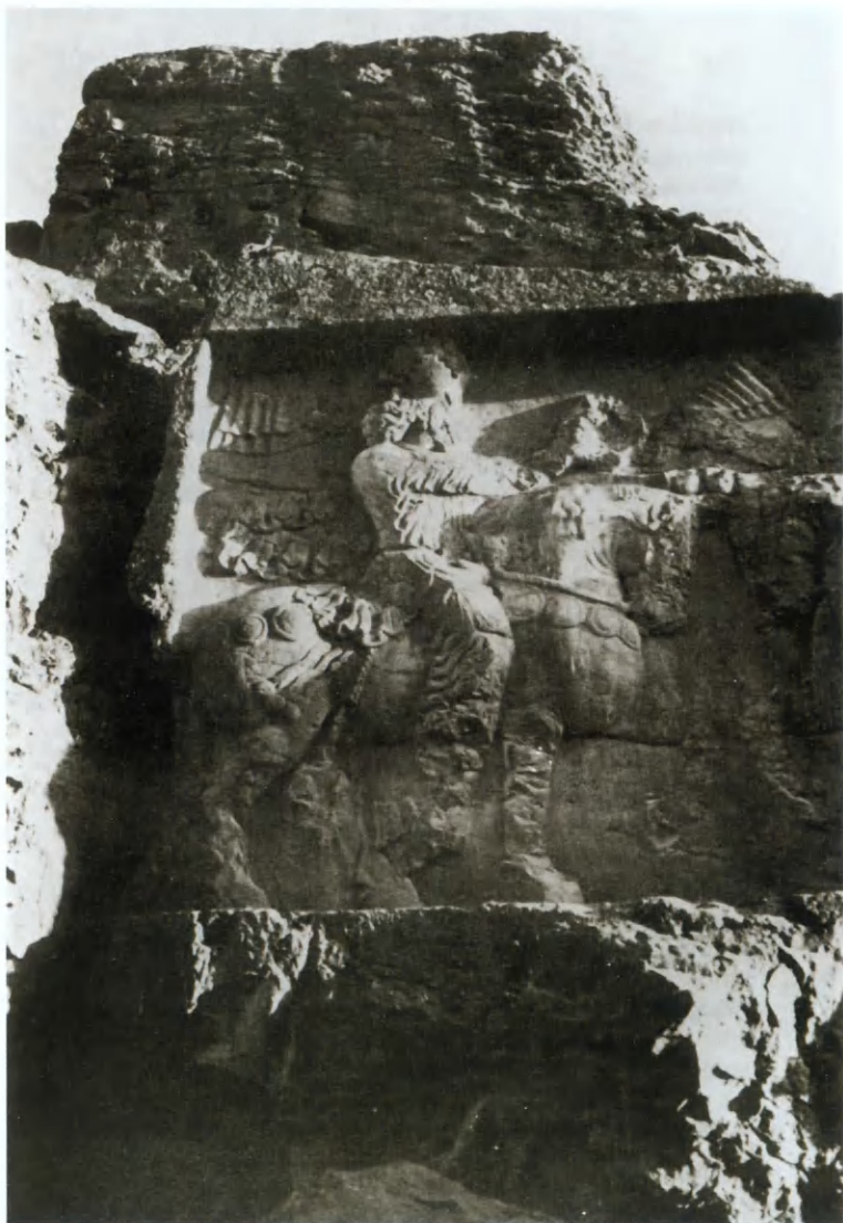
Шапур-триумфатор. Накш-и-Раджаб. Этот рельеф изображает Шапура I и относится к III в. до н. э. Победителем Юлиана стал Шапур II, живший на несколько столетий позже. Однако искусство за этот период не слишком изменилось, и вполне можно представить себе, что триумф Шапура II над Юлианом выглядел так же.