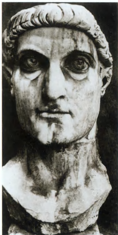
Император Константин Великий. Обломок статуи-колосса из Рима.