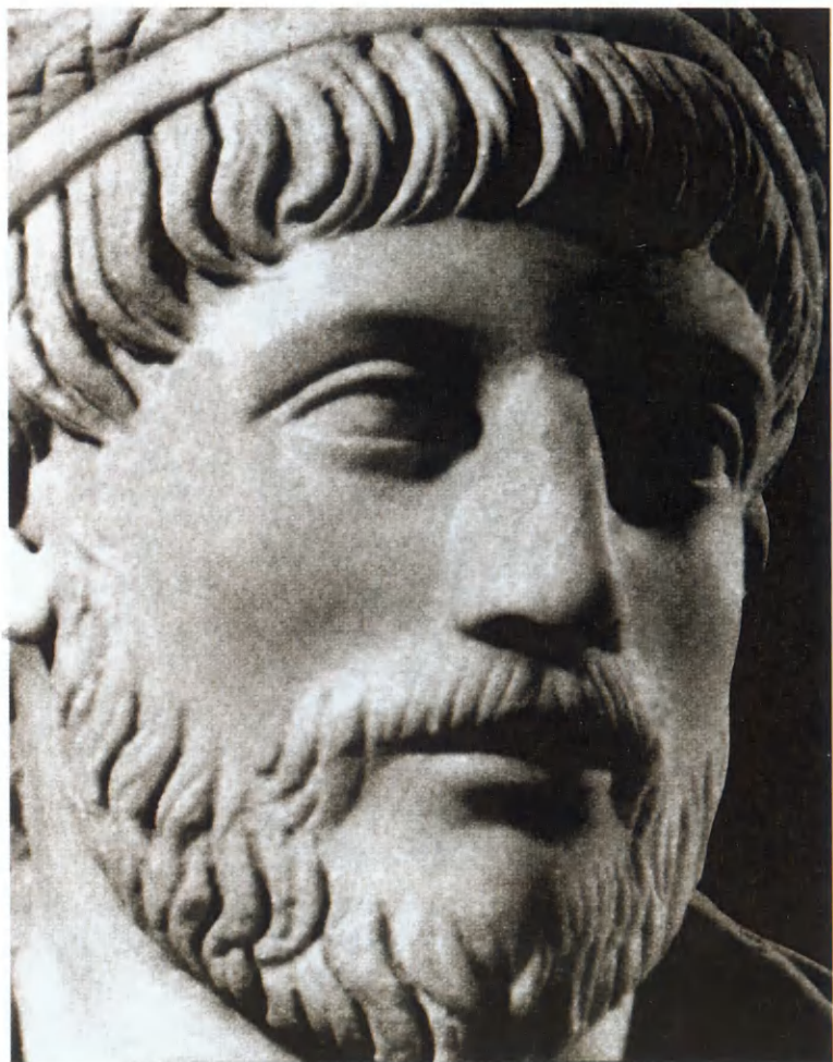
Предполагаемый бюст императора Юлиана.