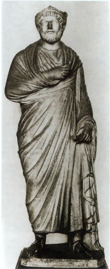
Статуя, изображающая императора Юлиана. Лувр