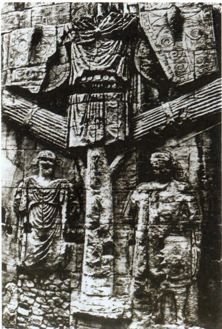
Триумфальная арка в Карпентре. Закованные в цепи пленники, разваливающийся на части трофейный монумент — это образ самой Римской империи, какой она стала после смерти Юлиана.