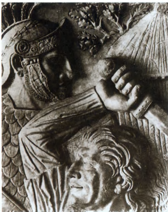
Римский легионер в единоборстве с германским воином. Изображение на колонне Трояна