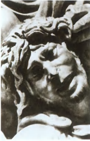
Голова варвара. Деталь саркофага. Рим. В изображении страданий погранных народов проглядывают черты страдающего Христа.