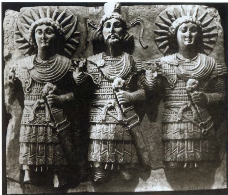
Солнечная Троица воинов. Пальмира.