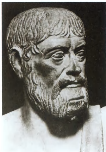
Император Юлиан в период пребывания в Антиохии.