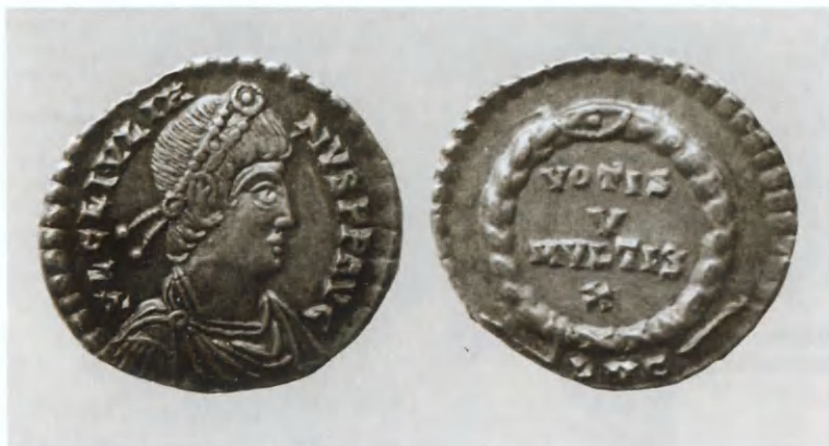
Монета императора Юлиана, отчеканенная в Галлии. Лицевая и оборотная стороны