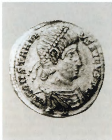
Монета императора Магненция.